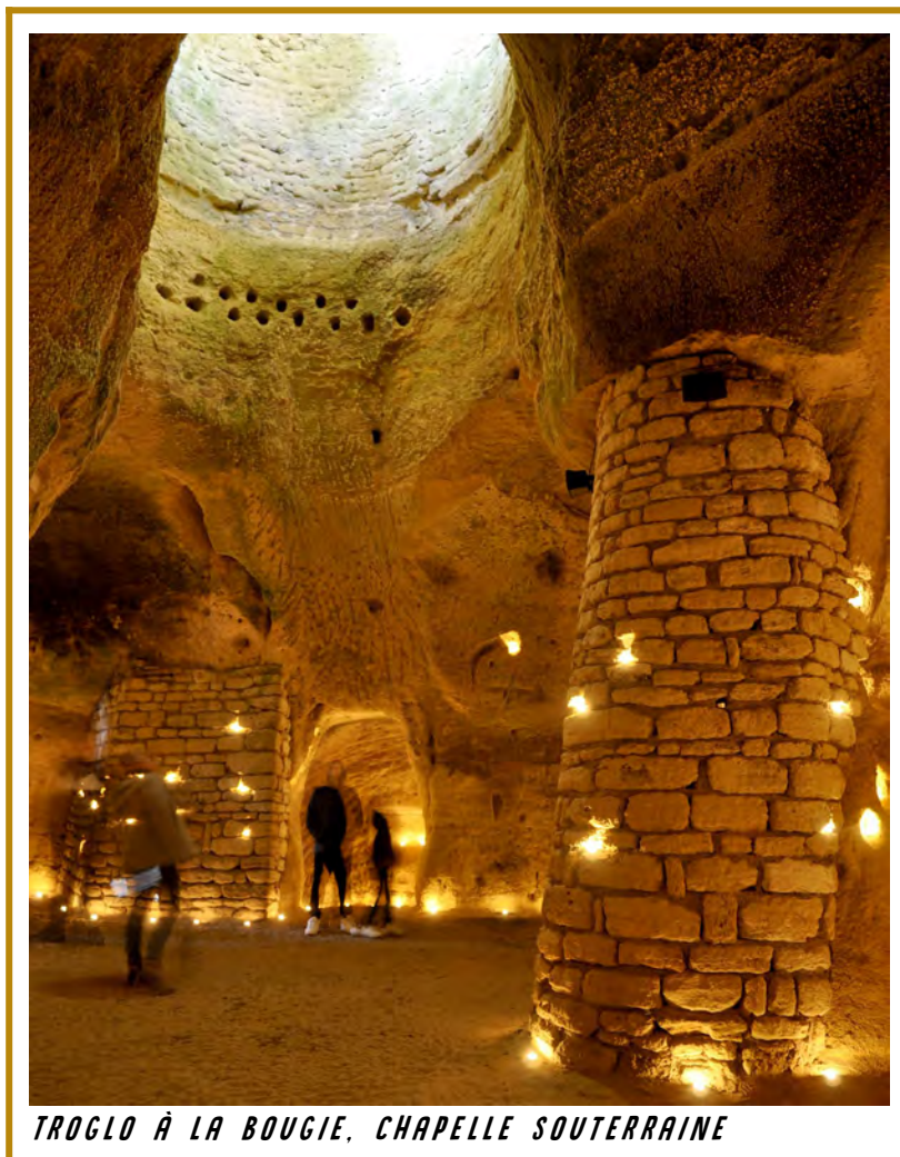
TROGLO À LA BOUGIE, CHAPELLE SOUTERRAINE