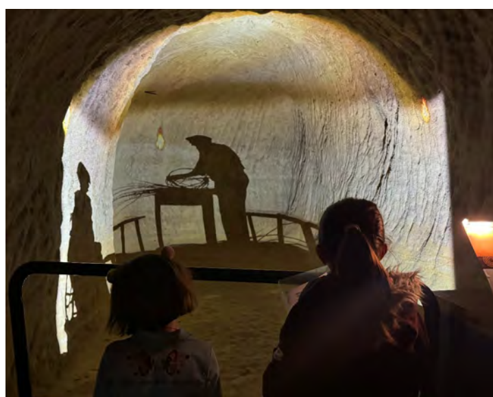
LA VEILLÉE DES OMBRES

La Veillée des ombres projetée sur les parois de la cavité avec les bruits d'ambiance vous plongent dans l'atmosphère d'une veillée villageoise. Les ombres émergent des murs et vous invitent à partager un moment au travers du temps. Souv