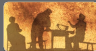
La veillée des ombres