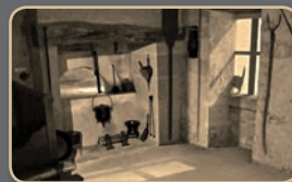
Habitation augmentée son 5.1 + ambiance lumineuse