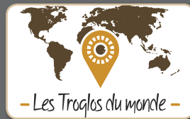
Carte interactive tactile