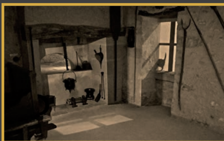
Habitation augmentée son 5.1 + ambiance lumineuse